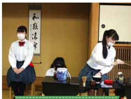
総合文化(茶道班・美術班)